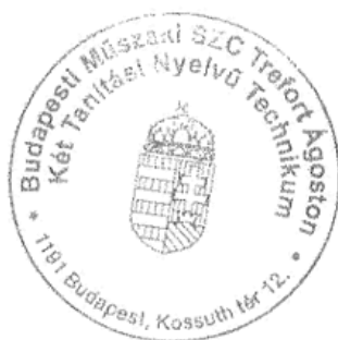
Varsóci Károly igazgató